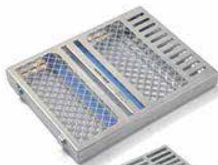
ZTR201 mm 274x202x30h para 12 instrumentos + espacios modulares