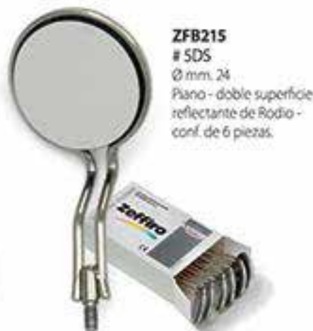
ZFB215 # SDS Ø mm. 24 Plano - doble superficie reflectante de Rodio - conf. de 6 piezas.