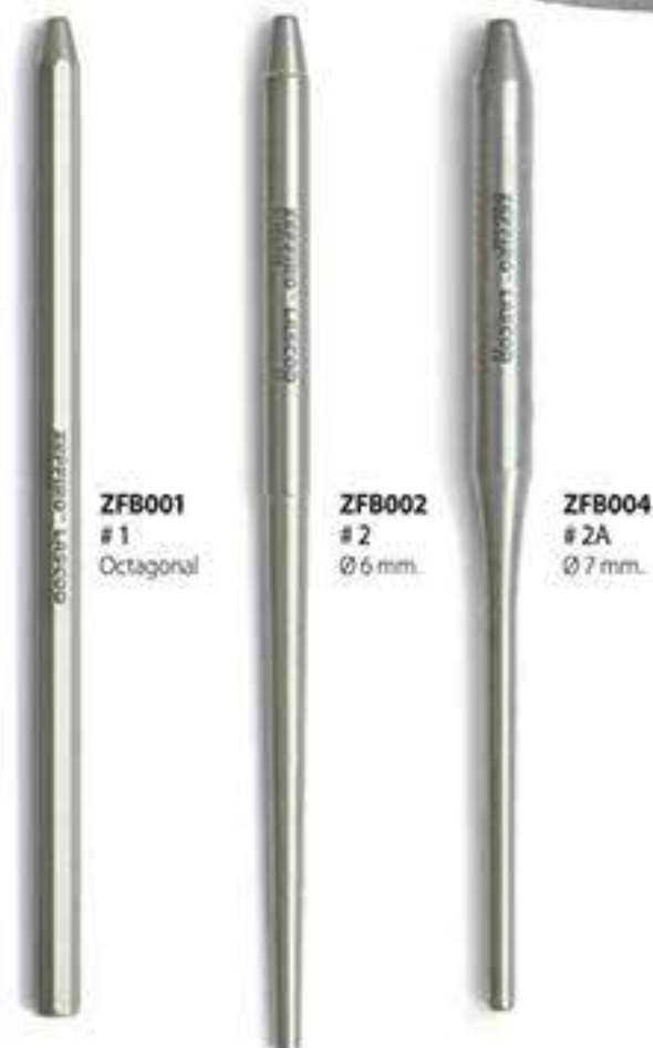
ZFB001 # 1 Octogonal