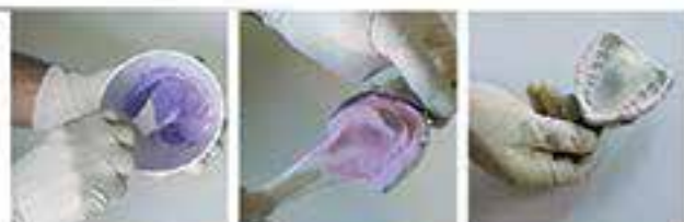
Etapas del cambio de color Kromopan