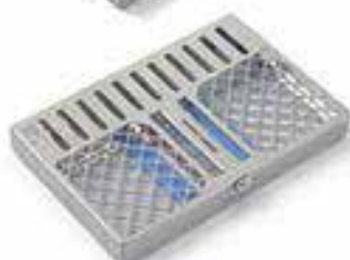
ZTR111 mm 202x140x24h para 5 instrumentos + espacios modulares