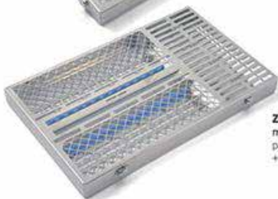
ZTR301 mm 370x235x34h para 14 instrumentos + espacios modulares