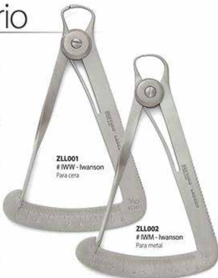
ZLL001 # IWW - Iwanson Para cera