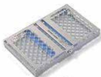
ZTR101 mm 222x140x25h para 8 instrumentos