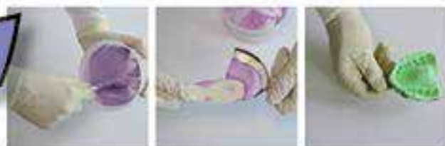
Etapas del cambio de color Alginor

alta fidelidad de las dimensiones en el tiempo