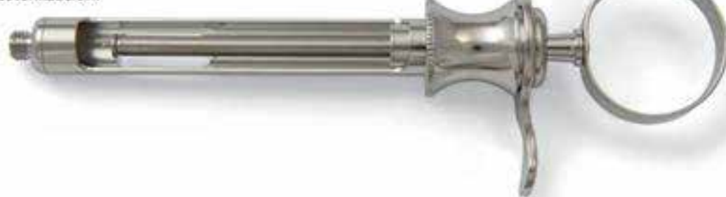
ZFZ900 con succión 1,8 ml. cm. 13,5

Los instrumentos Zeffiro están hechos con una selección y prueba de las mejores formulaciones de acero quirúrgico (de acuerdo con la norma UNI EN ISO 7153 - 1) para asegurar su funcionalidad en tiempo, la máxima resistencia a la corrosión y un alto estándar de calidad, lo que los hace adecuados para cualquier técnica de saneamiento y esterilización.