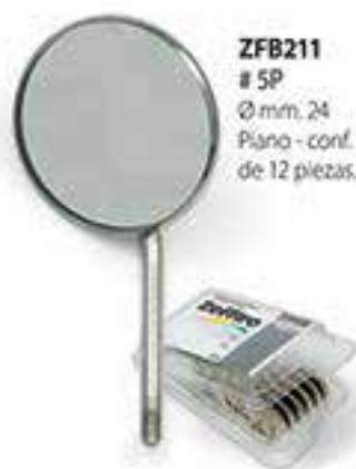
ZFB211 # 5P Ø mm. 24 Plano - conf. de 12 piezas.

Estudios universitarios demuestran que estas áreas han sido identificadas como las más peligrosas, capaces de retener el material orgánico incluso después de una fase de limpieza cuidadosa.